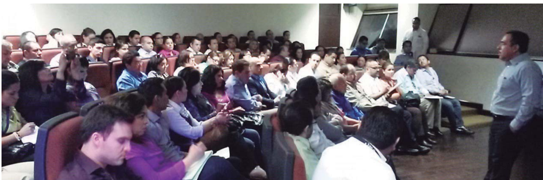
Capacitación a servidores públicos en tema de apego a las normas.