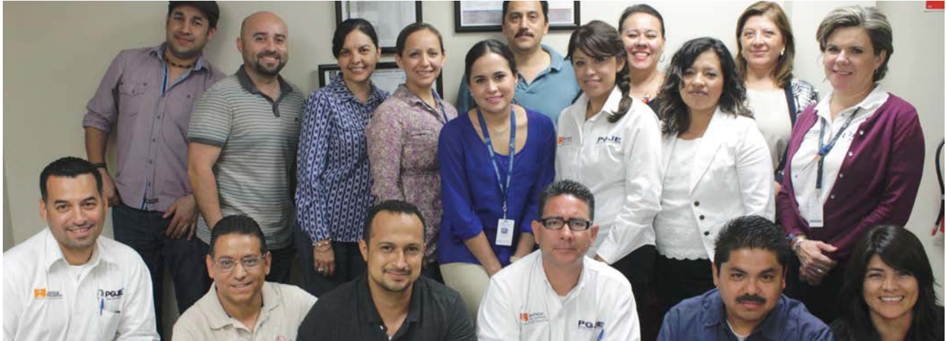
Capacitación en el tema de análisis de problemas a servidores públicos.

Llevamos a cabo el primer proceso de Evaluación del Desempeño 2014, en el que evaluamos a cuatro mil 221 servidores públicos, que forman parte de las diferentes dependencias, tomando como base las competencias requeridas y establecidas en las cédulas de puesto específico, para el cumplimiento de la misión y funciones que correspondan; así como los factores generales que inciden con el rendimiento global; orientando dicho proceso al logro de resultados.