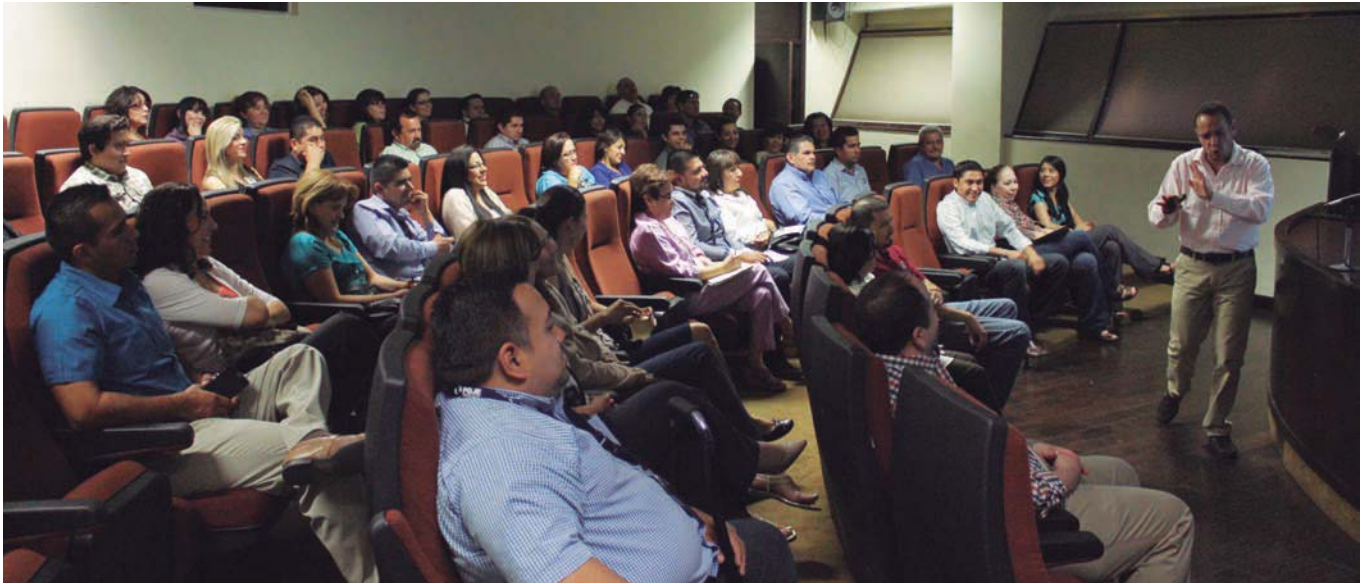
Capacitación a servidores públicos.

fortalecer actitudes y habilidades intelectuales y sociales. Realizamos 101 eventos en Mexicali, 59 en Tijuana, 29 en Ensenada, 16 en Tecate, nueve en Playas de Rosarito y seis en San Quintín, logrando la participación de tres mil 662 servidores públicos en todo el Estado.